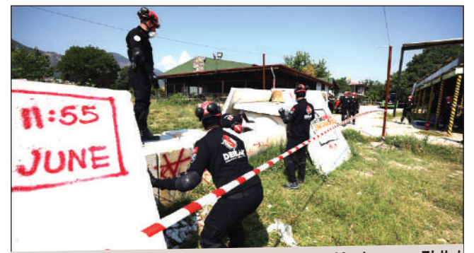
Denizli Büyükşehir Belediyesi Arama Kurtarma Ekibi