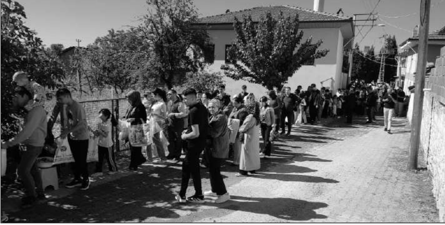
çocuklarıyla birlikte katıldı. Mahalle sakinleri ise evlerinin önünde hazırladıkları çikolata, şekerleme, kek, bisküvi, tatlı ve kuruyemişleri çocuklara dağıtarak bayram sevincine ortak oldu.

Denizli merkez başta olmak üzere çevre il ve ilçelerden yoğun katılımın olduğu etkinliğe, Serinhisar'a bağlı Yatağan, Ayaz, Kuyucak ve Kocapınar mahallelerinden de yüzlerce aile ço-