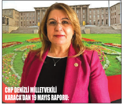
CHP DENİZLİ MİLLETVEKİLİ KARACA'DAN 19 MAYIS RAPORU:

Türk Ulusu'nun kurtuluş meşalesinin yakıldığı günün anısına Gazi Mustafa Kemal Atatürk'ün gençlere armağan olarak bıraktığı 19 Mayıs Atatürk'ü Anma, Gençlik ve Spor Bayramı, 107. yılında da coşkulu törenlerle kutlandı. Sabahın erken saatlerinden itibaren başlayan kutlamalar, kurtuluş meşalesinin yeniden yakıldığı etkinliklere evrildi. Gençler, Ata'nın bıraktığı mirasın ilelebet savunucusu olacaklarını bir kez daha ve gur bir sesle haykırdı. Denizli'de Atatürk Anıtı'na çelenk sunumuyla başlayan bayram coşkusu, Delikliçinar'dan Valilik önüne uzanan kortej yürüyüşü ile devam etti, kutlama etkinlikleriyle doruğa ulaştı. »Haberı Sayfa 7'de