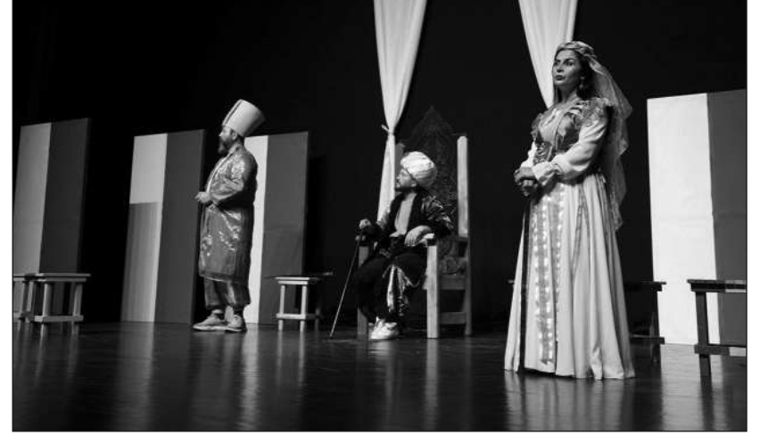
TİYATRO COŞKUSU İLÇELERE DE TAŞINDI Festival bu yıl sadece şehir mer-

Festival kapsamında; ekipler, Denizli sokaklarını ve sahnelerini sanatla buluşturuyor. 4'ü yurt dışından toplam 28 tiyatro topluluğu şehrin farklı noktalarındaki sahnelerde oyunlarını sanatseverlerin beğenisine sundu. Konuk ekiplerin katılımıyla bugüne kadar gerçek-